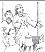
Jesús enseñó con autoridad